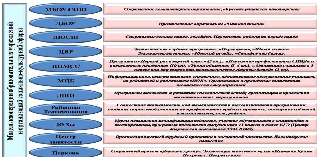
Схема 2. Направления деятельности социокультурного центра «НОК»