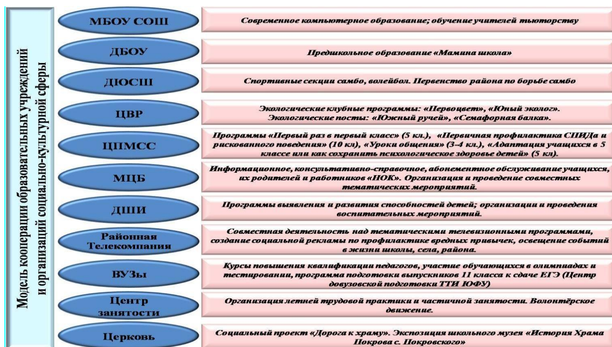
Схема 1. Взаимодействие образовательных учреждений и организаций социокультурной сферы

В микрорайоне школы находятся все административные учреждения районного центра, учреждения культуры и спорта – МБОУ ДО «ДЮСШ», стадион и спортивный комплекс «Миус» Покровского сельского поселения, Районный Дом культуры имени А.В. Третьякова, МБУК МЦБ имени И.М. Бондаренко, районный кинотеатр «Мир», МБОУ ДО «ЦВР», МБОУ ДО «ДШИ», учреждения здравоохранения, центр психолого-медико-социального сопровождения, два детских сада, районная телекомпания «Приазовский оптималист», районный отдел внутренних дел, церковь, центр занятости населения, пенсионный фонд. Таким образом, в микрорайоне школы немало возможностей для развития индивидуальных способностей детей, их воспитания.