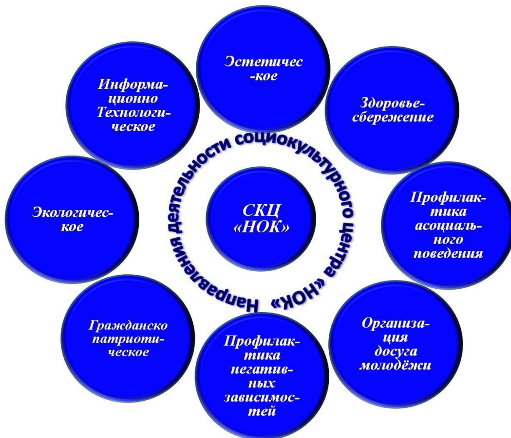
Схема 3. Модель социокультурного взаимодействия МБОУ Покровская СОШ «НОК»